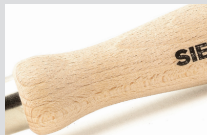
Handgreep in blank hout en gemakkelijk te kuisen