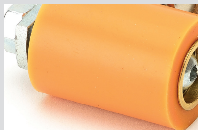
Hoogste kwaliteit siliconen voor een lange levensduur