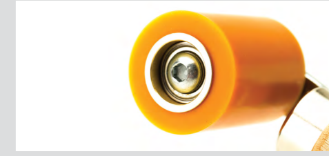
Komplettes Andruckrollen Sortiment!