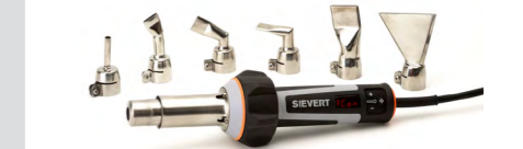
Komplettes Schweißdüsen Sortiment