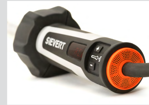
Einzigartiges Design und Ergonomie!