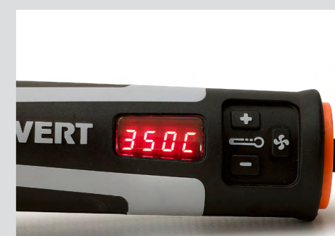
Gut ablesbares Display mit einzigartiger Temperaturgenauigkeit