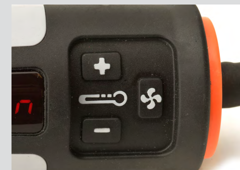
Einzigartige und intuitive Bedienung