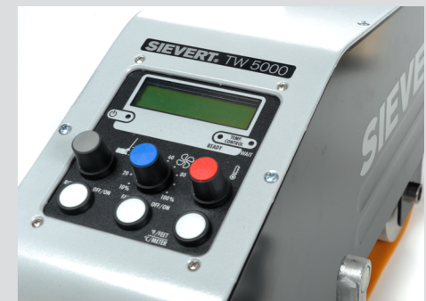
Ecran numérique de commande facile à manipuler