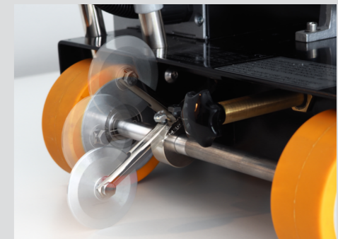
Roue de guidage