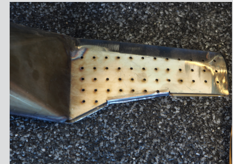
Buse spéciale 130 mm