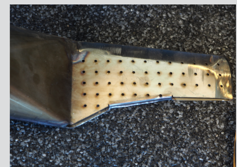
130 mm munnstykke