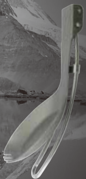
Folding handle Poignée repliable

La poignée repliable rend le produit compact lors de son rangement. Le titane dans la cuvette de la cuillère-fourchette rend ce produit ultra léger. Poignée en acier inoxydable, ergonomiquement conçue pour une haute résistance